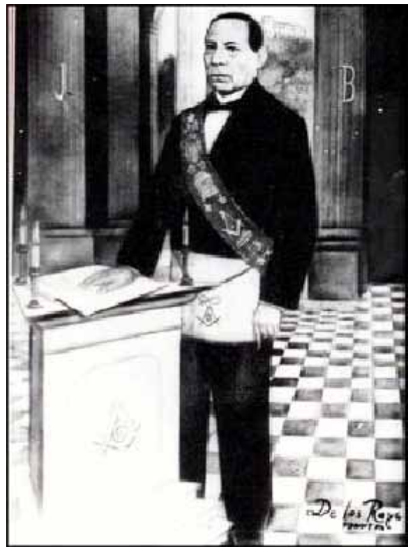
Benito Juárez García, el «Benemérito de las Américas», Q. H. con reconocimiento en toda Latinoamérica y el mundo

Porque con esta acción ha cometido hechos delictuosos como lo es de apropiarse sin derecho de un bien público, en una vía de comunicación, daños a un monumento que el gobierno del Estado había eri-